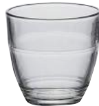
1016A B06 (1060) ジゴン ¥360(本体価格)