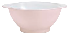
2005S F06 A11SL ニセンボウル パステル PK ¥1,850(本体価格)