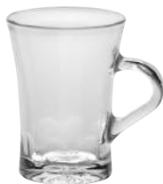
4001A R06 アマルフィ マグ ¥570(本体価格)