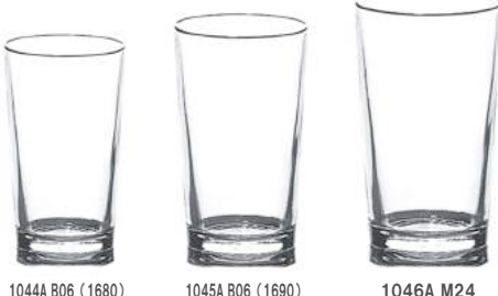
1044A B06 (1680) 1045A B06 (1690) 1046A M24