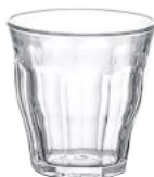
1027A B06 (1140)