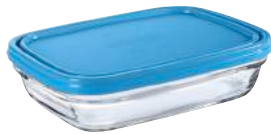
9144A M06 カレボウル ¥2,600(本体価格)