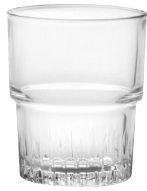
1014A B06 (1830) エンピラブル ¥500(本体価格)