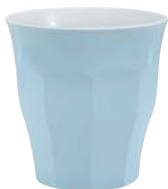
1026S R06 A11SK ピカルディパステル BL ¥1,140(本体価格)

■ DURALEXピカルディーが、2012年度グッドデザインロングライフ賞を受賞。 ■ 2013 G デザインロングライフ候補展示会に数ある歴代の G ロングライフ商品の中からピカルディーが選ばれました。 【受賞対象名】DURALEX PICARDIE デュラレックス ピカルディーシリーズ