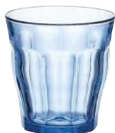
1028B B06 (1133)