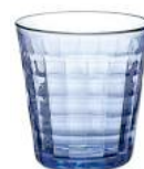
1032B C04 (1553)