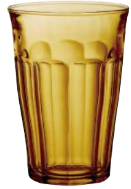
1029D B06 ピカルディアンバー ¥1,150(本体価格)