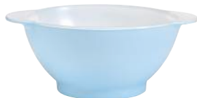
2005S F06 A11SK ニセンボウル パステル BL ¥1,850(本体価格)