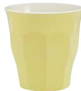
1026S R06 A11SM ピカルディパステル YE ¥1,140(本体価格)