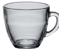
4006A R06 (4210) ジゴン マグ ¥800(本体価格)