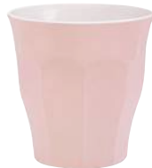
1026S R06 A11SL ピカルディパステル PK ¥1,140(本体価格)