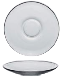
4007A F06 (4030) ジゴン ソーサー ¥530(本体価格)