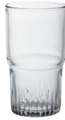
1063A B06 エンピラブル ¥710(本体価格)