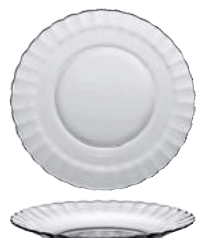
3024A F06 (3400)