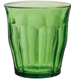
1028G B06 ピカルディ グリーン ¥700(本体価格)