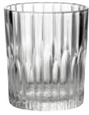
1056A B06 マンハッタン ¥650(本体価格)