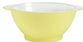
2005S F06 A11SM ニセンボウル パステル YE ¥1,850(本体価格)