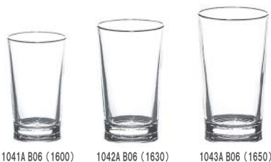
1041A B06 (1600) 1042A B06 (1630) 1043A B06 (1650)