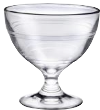
5002A B06 ジゴン デザートカップ ¥1,050(本体価格)