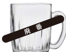
5.10270 (1510) オルレアン ¥930(本体価格)