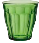
1027G B06 ピカルディ グリーン ¥650(本体価格)