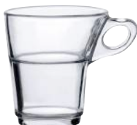
4027A R06 カプリス ¥850(本体価格)