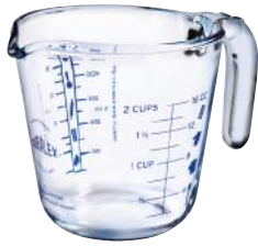
5016A M06 メジャーカップ ¥3,250(本体価格)