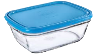
9148A M06 カレボウル ¥3,510(本体価格)