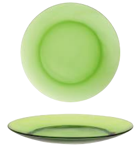
3006G F06 リス ディナープレート グリーン ¥810(本体価格)