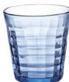
1033B C04 (1563)