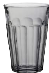
1027J C04 ピカルディ プラム ¥650(本体価格)