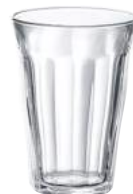
1029A B06 (1120)