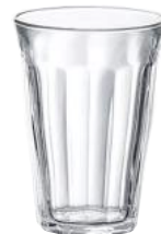
1030A B06 (1320)