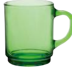
4020G R06 ベルサイユ スタックマグ グリーン ¥840(本体価格)