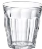
1028A B06 (1130)