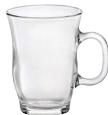
4022A R06 エッフェルマグ ¥680(本体価格)