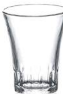
1005A C04 (2010)