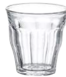
1026A B06 (1150)