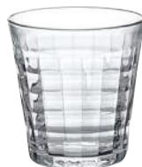
1035A B06 (1470)