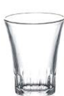
1004A C04 (2020)