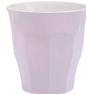
1026S R06 A11SN ピカルディパステル PU ¥1,140(本体価格)