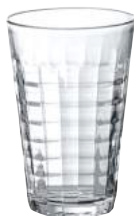
1034A B06 (1570)