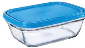
9146A M06 カレボウル ¥2,860(本体価格)