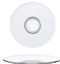
4028A F06 カプリス ソーサー ¥520(本体価格)