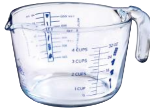
5017A M06 メジャーカップ ¥3,900(本体価格)