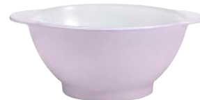
2005S F06 A11SN ニセンボウル パステル PU ¥1,850(本体価格)