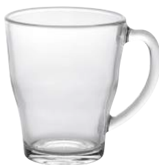
4029A R06 コージーマグ ¥1,000(本体価格)