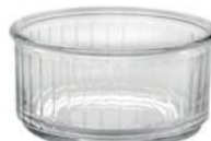
5009A C04 (2400)