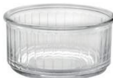
5010A C04 (2380)