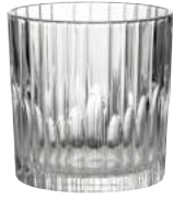
1057A B06 マンハッタン ¥880(本体価格)