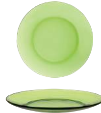
3008G F06 リス デザートプレート グリーン ¥590(本体価格)