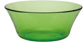
2008G F06 ニセンボウル グリーン ¥1,850(本体価格)