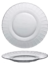
3023A F06 (3260)